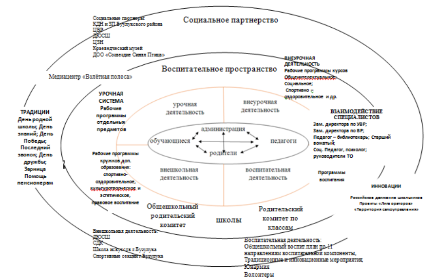
Модель воспитательной системы МОБУ «Палимовская СОШ»

Школа находится в условиях постоянного взаимодействия с учреждениями системы образования, культуры и спорта, правоохранительными органами и органами государственной власти. Эти творческие контакты возникли в силу объективной необходимости, территориальной близости и общности состава участников воспитательного процесса.