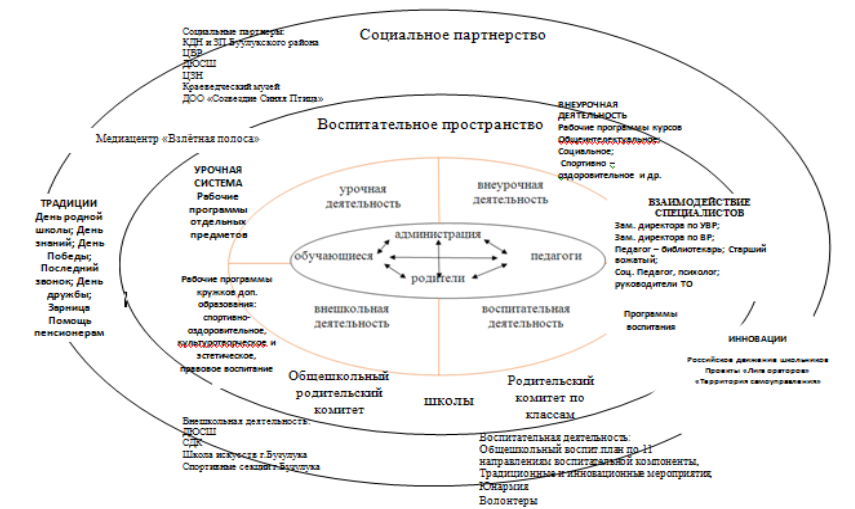
Модель воспитательной системы МОБУ «Палимовская СОШ»

Школа находится в условиях постоянного взаимодействия с учреждениями системы образования, культуры и спорта, правоохранительными органами и органами государственной власти. Эти творческие контакты возникли в силу объективной необходимости, территориальной близости и общности состава участников воспитательного процесса.