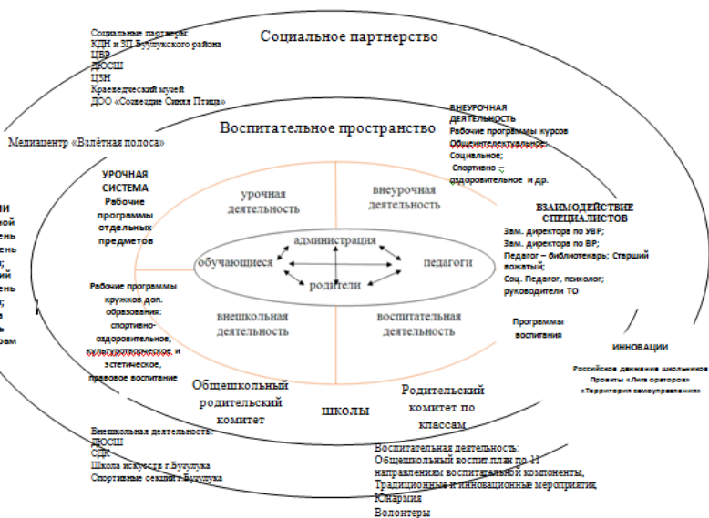
Модель воспитательной системы МОБУ «Палимовская СОШ»

Школа находится в условиях постоянного взаимодействия с учреждениями системы образования, культуры и спорта, правоохранительными органами и органами государственной власти. Эти творческие контакты возникли в силу объективной необходимости, территориальной близости и общности состава участников воспитательного процесса.